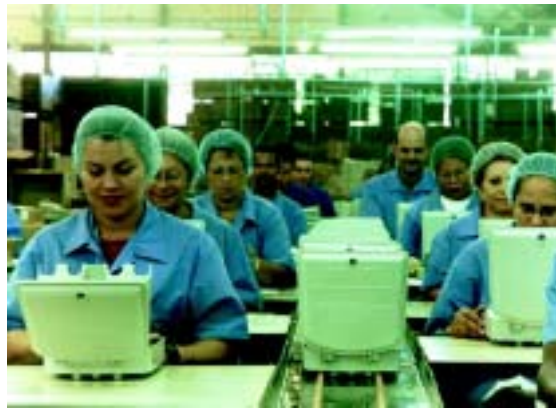
Bargoa (Brasil) (Fábrica de componentes para la industria de telecomunicaciones, automotriz y auxiliar)

Recursos Humanos: Se ha puesto en práctica un Plan de Ayuda Ciudadana reflejado en la colaboración de desayunos para colegios estatales, participación en concursos escolares, colaboración en fiestas provinciales donde nuestra empresa está presente, así como auspicios como la ayuda al programa «Adopte un Atleta» donde se aseguró la participación de un atleta en las Olimpiadas Especiales Japón 2005.