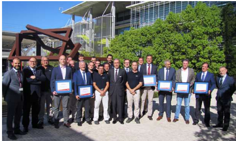
Celebración de la primera jornada de Seguridad y Salud en Campus Palmas Altas, Sevilla.

Además, la compañía continúa celebrando trimestralmente sus comités de Seguridad y Salud directamente con presidencia y los principales ejecutivos de PRL, y tienen como fin monitorizar y alertar todos los aspectos relacionados con el área, tales como la implementación de las medidas necesarias de Seguridad y Salud en cada puesto de trabajo y el análisis de los ratios de siniestralidad, así como el seguimiento de los objetivos fijados para cada una de las materias que se traten. 403-1