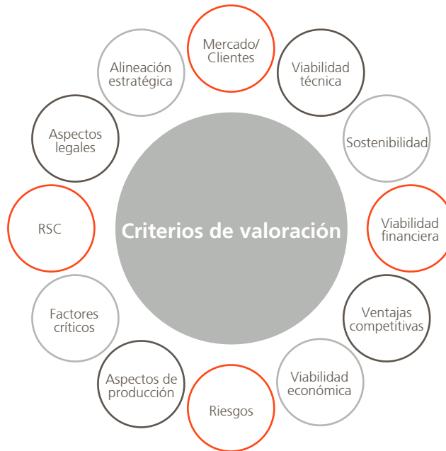
Criterios incorporados en la valoración de la I+D

La valoración de la I+D incorpora una reflexión sobre cuestiones esenciales de la estrategia de la organización: cómo encajan en ella los programas definidos, cómo se alinean los proyectos y los programas, o de qué forma se diversifica el riesgo. Además, permite analizar la viabilidad de las diferentes líneas de trabajo, con sus costes y sus retornos considerados en su totalidad. Con ello se consigue identificar el impacto de la I+D en los resultados presentes de Abengoa y en sus proyecciones a corto, medio y largo plazo.