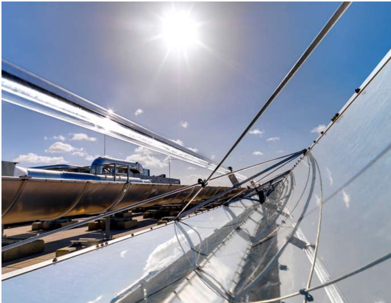
Colectores cilindro-parabólicos de una de las plantas solares de Abengoa