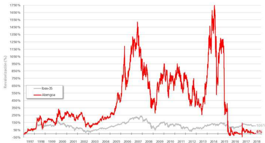
Evolución de la Capitalización de Abengoa en Bolsa (comparado con Ibex-35)