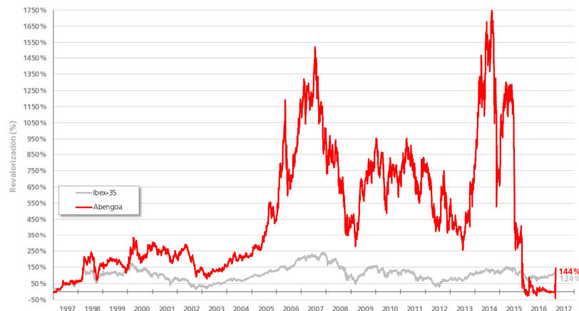
Evolución de la Capitalización de Abengoa en Bolsa (comparado con Ibex-35)

Desde su salida a Bolsa, el 29 de noviembre de 1996, el valor de la Compañía se ha revalorizado un 144% respecto al valor inicial. Durante este mismo periodo de tiempo, el selectivo IBEX-35 se ha revalorizado un 124%.